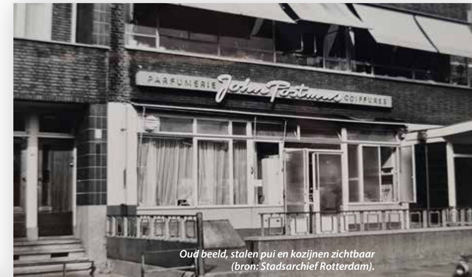
Oud beeld, stalen pui en kozijnen zichtbaar.

Om deze opgave succesvol tot een einde te brengen, deed Katheleine Koornstra, bouwhistoricus bij Hylkema Erfgoed,