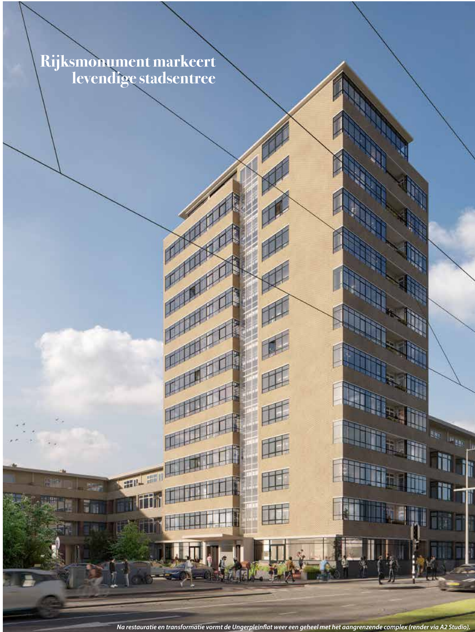
Na restauratie en transformatie vormt de Ungerpleinflat weer een geheel met het aangrenzende complex.

Rijksmonument markeert levendige stadsentree