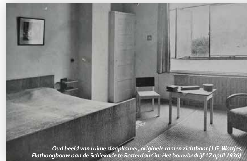
Oud beeld van ruime slaapkamer, originele ramen zichtbaar (J.G. Wattjes, Flathoogbouw aan de Schiekade te Rotterdam' in: Het bouwbedrijf 17 april 1936).

onderzoek naar de flat. Haar analyse begon met een speurtocht naar de originele bouwtekeningen.