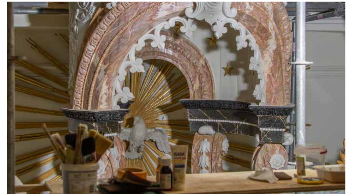
REEDS BLOOTGELEGD: DIVERSE SOORTEN MARMERIMITATIES WORDEN ZICHTBAAR OP HET HOOFDALTAAR.

De overdaad aan gouden accenten was bepaald niet oorspronkelijk. Tijd voor nadere studie.