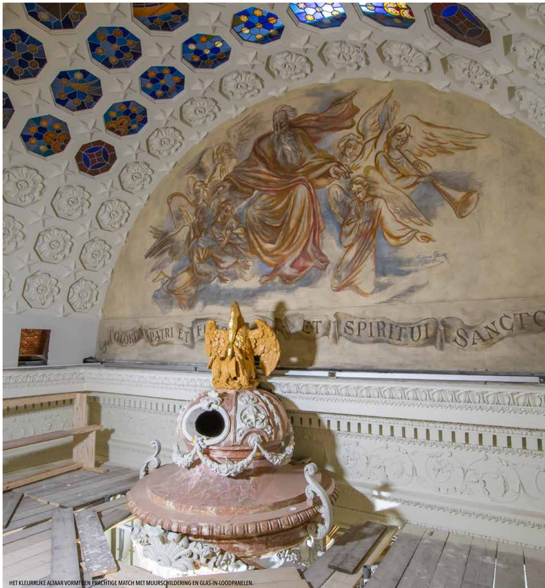
HET KLEURRIJKE ALTAAR VORMT EEN PRACHTIGE MATCH MET MUURSCHILDING EN GLAS-IN-LOODPANELEN.