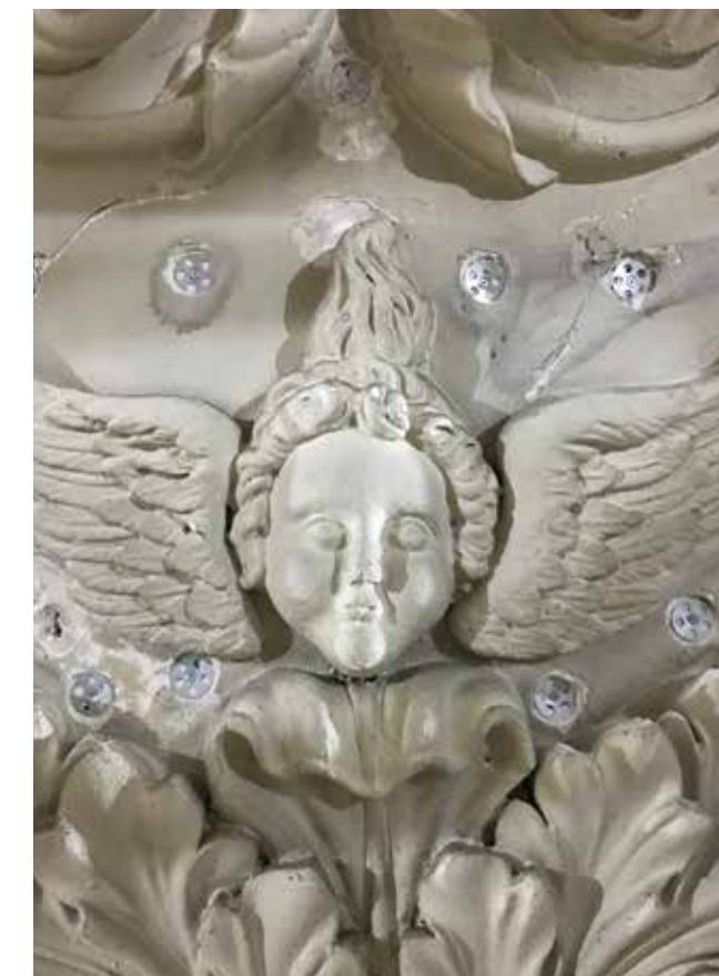
STUCORNAMENT MET DE VERZONKEN SCHROEVEN.