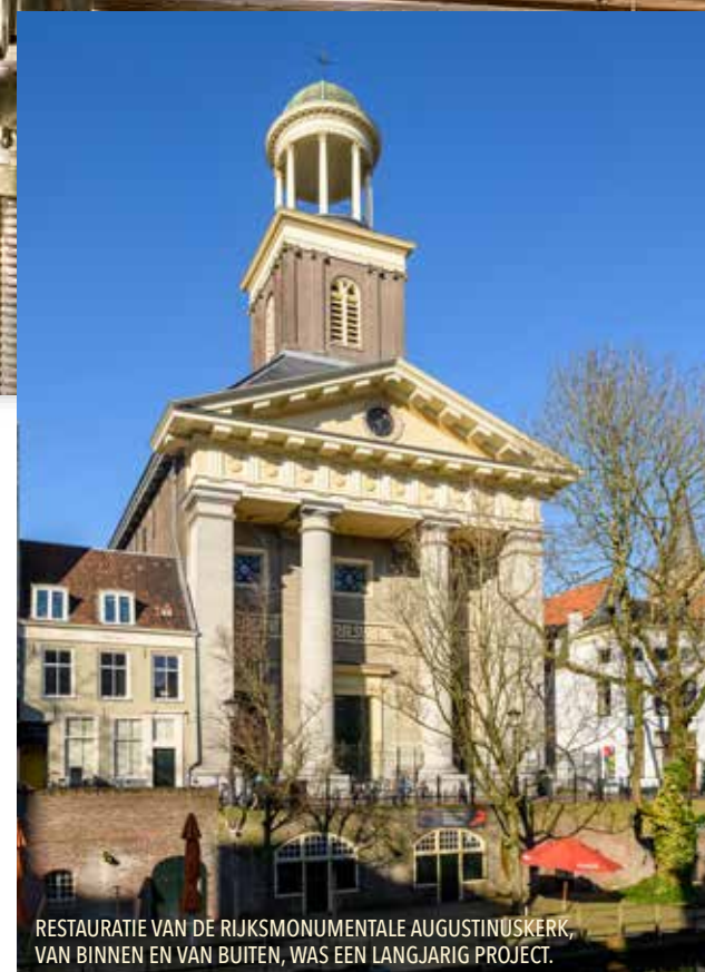
RESTAURATIE VAN DE RIJKSMONUMENTALE AUGUSTINUSKERK, VAN BINNEN EN VAN BUITEN, WAS EEN LANGJARIG PROJECT.