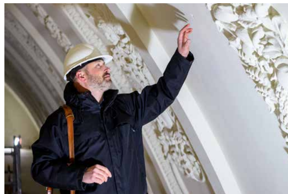
FOTO'S RECHTER PAGINA: EEN OMVANGRIJK STEIGERCOMPLEX MAAKT RESTAURATIE VAN HET GEWELF MOGELIJK.