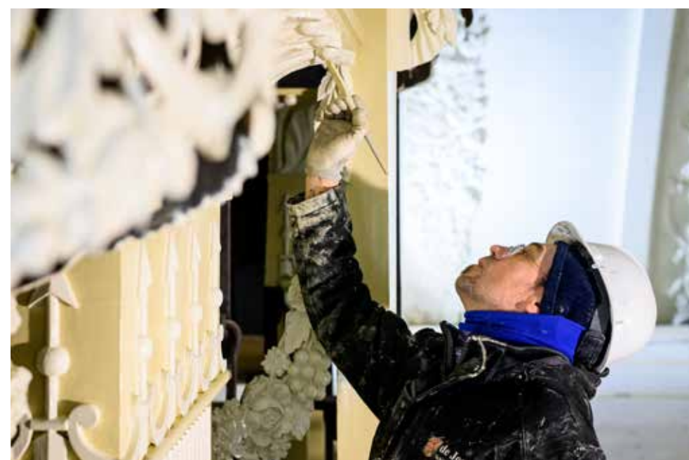
FOTO RECHTS: HET LINDSEN-ORGEL IS TERUGGEBRACHT NAAR ZIJN ORIGINELE KLEURSTELLING.

Wie gewend is aan nogal zware, neoclassicistische, religieuze kunst zal zich bij het zien van deze muurschildering verbazen.